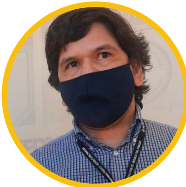
Fiscal Jorge Arce