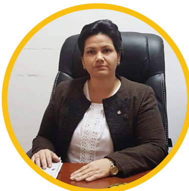
Fiscal Claudelina Corvalán