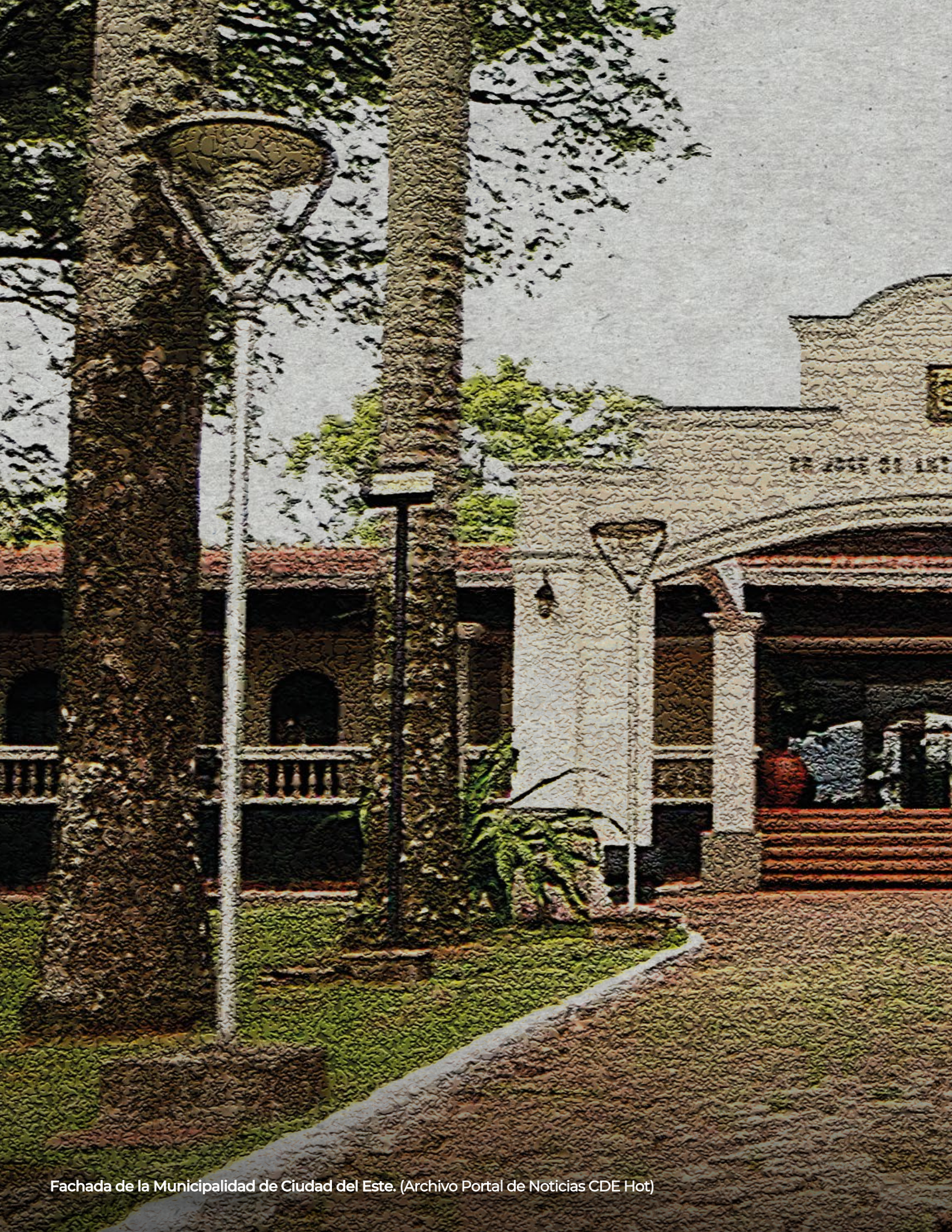
Fachada de la Municipalidad de Ciudad del Este.