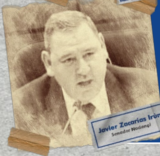
Javier Zacarías Irún Senador Nacional