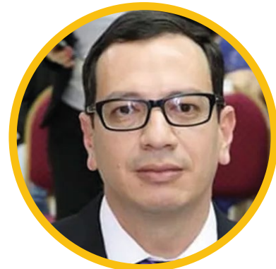
Fiscal Diego Arzamendia