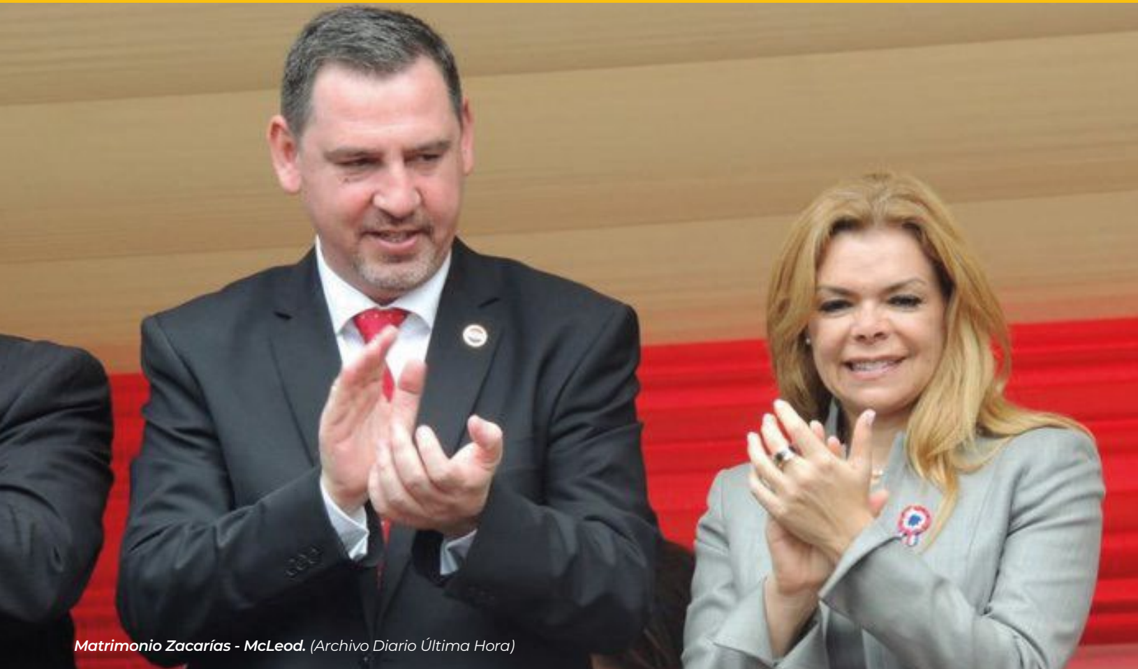
Matrimonio Zacarías - McLeod.

El expediente judicial N° 13/2019 fue abierto en enero de 2019 contra Sandra McLeod, entonces intendenta de Ciudad del Este en su tercer período, funcionarios municipales y sus familiares. El hecho punible imputado a la jefa comunal es lesión de confianza al autorizar pagos a la firma "Frontera Producciones" por servicios de publicidad y propaganda no contemplados en las licitaciones y contratos suscritos (1) (2)