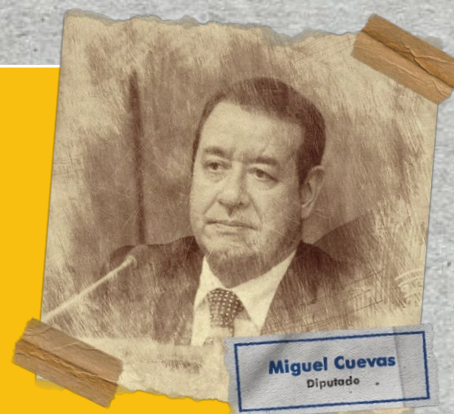
Miguel Cuevas Diputado

Miguel Cuevas es investigado por la comisión de los hechos punibles de Enriquecimiento Ilícito, Tráfico de Influencias y Declaración Falsa, desde el 2009 al 2019 por un valor de Gs. 1.705.315.135. El Tribunal de Apelación Penal rechazó una recusación planteada por la defensa del diputado por lo que se podrá realizar el juicio oral y público.