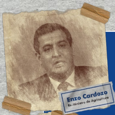
Enzo Cardozo Ex-Ministro de Agricultura