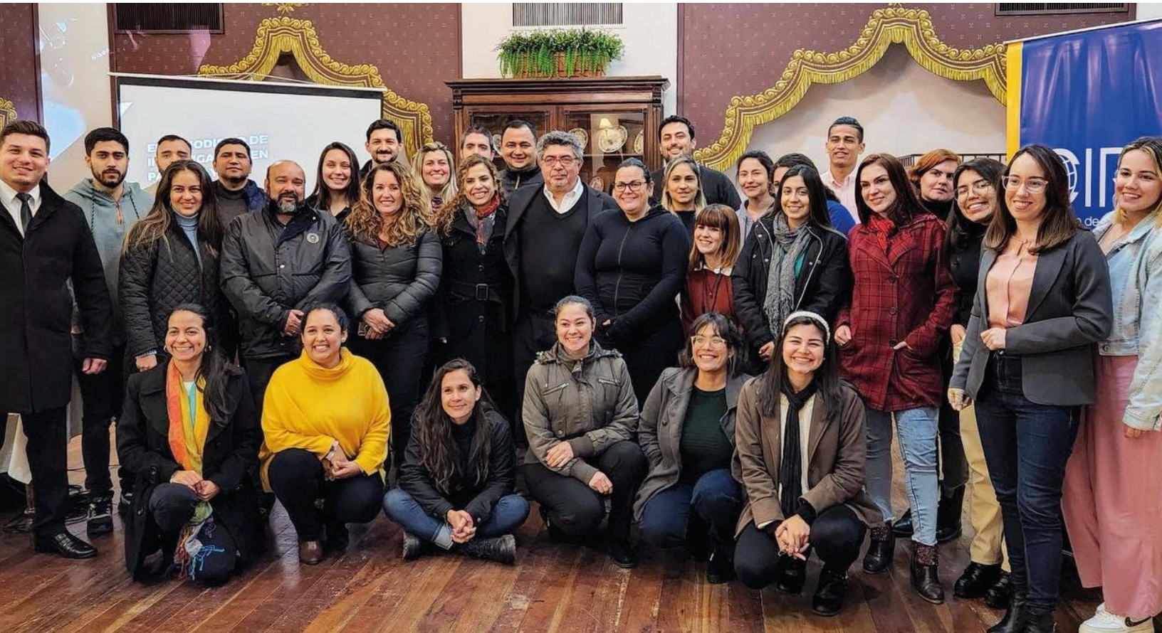
Primer día de clases del Entrenamiento de Alto Nivel en Periodismo de Investigación.