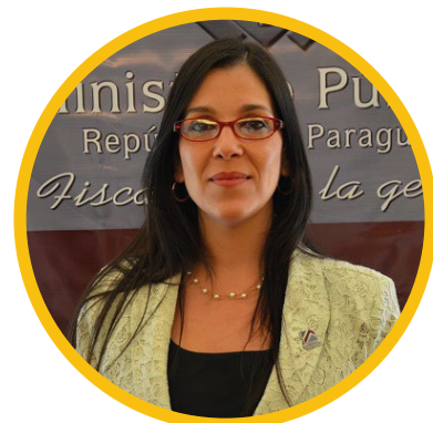
Fiscal Josefina Aghemo